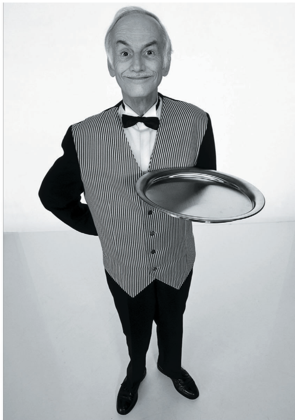
Was darfs denn sein? Relocation-Firmen sorgen für einen angenehmen Aufenthalt in der Schweiz.

Aber sie organisieren auch Rundfahrten, unterhalten eine 24-Stunden-Hotline, treiben Babysitter und Gärtner auf, helfen bei der Auswahl des Frauenarztes und erklären, warum hier zu Lande Rasenmähen am Sonntag nicht gut gelitten ist – «Händchen halten» auch bei persönlichen Fragen machen die Relocater zu Butlern auf Zeit. Und wenn das noch schönere Häuschen ein Dorf weiter und gleichzeitig in einem anderen Kanton liegt, sind die Relocater gefragt, weil das aus Behördensicht zu völlig neuen Sachlagen führt und ent-